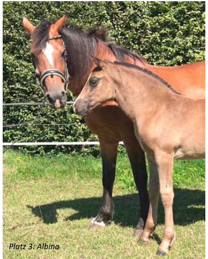
Platz 3: Albina