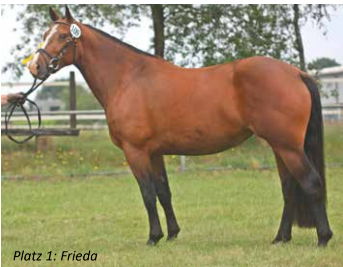
Platz 1: Frieda