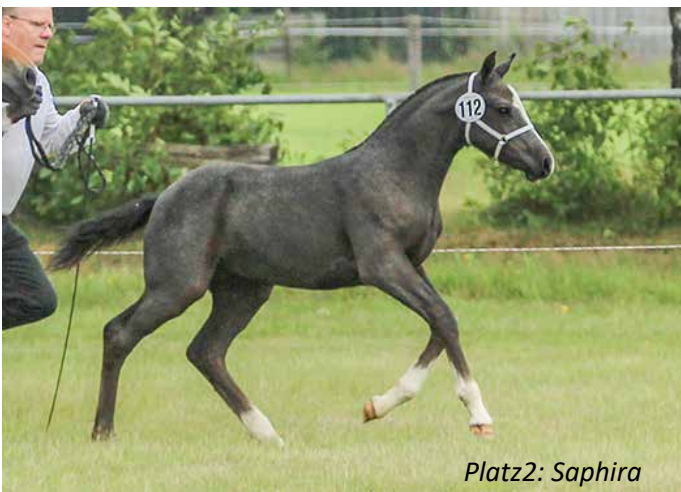
Platz 2: Saphira