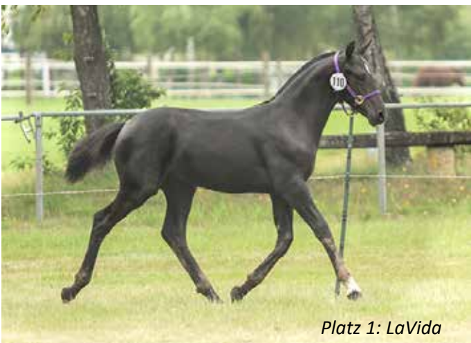
Platz 1: LaVida