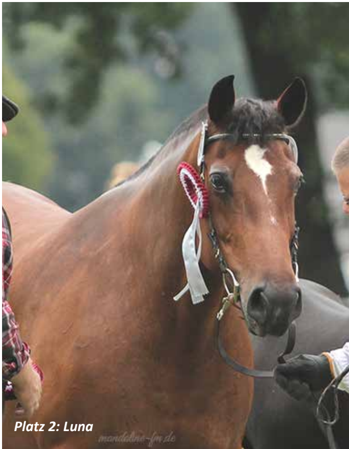
Platz 2: Luna